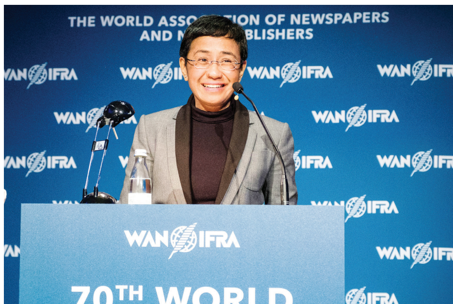
A editora executiva e CEO da Rappler, Maria Ressa, recebeu este ano o prémio Golden Pen of Freedom da WAN-IFRA